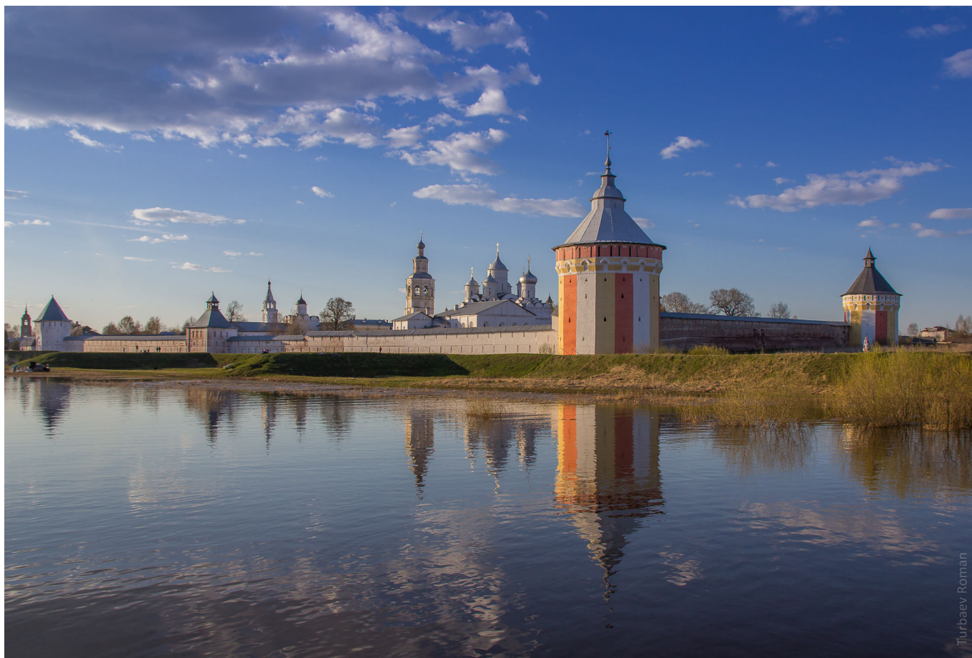
Спасо - Прилуцкий монастырь близ Вологды, основан прп. Димитрием Вологодским

Тому же больному иноку было видение целого сонма святых, и он подумал, что среди них и прп. Димитрий, но услышал голос: «Димитрия ты ищешь? Ныне он в Казани». Больной очнулся здоровым. А в тот же день вел. князь Иоанн Васильевич III одержал победу над татарами под Казанью (1503), и в час победы ему явился прп. Димитрий. В память этого вел. князь Иоанн III прислал в обитель икону преподобного. Епископ Вологодский принес ее с торжественным крестным ходом из города в монастырь. С тех пор каждый год 3 июня совершался до последнего времени в память этого крестный ход из города в монастырь. В Смутное время обитель прп. Димитрия трижды была разорена врагами, и тогда ее оградил каменными стенами и башнями.