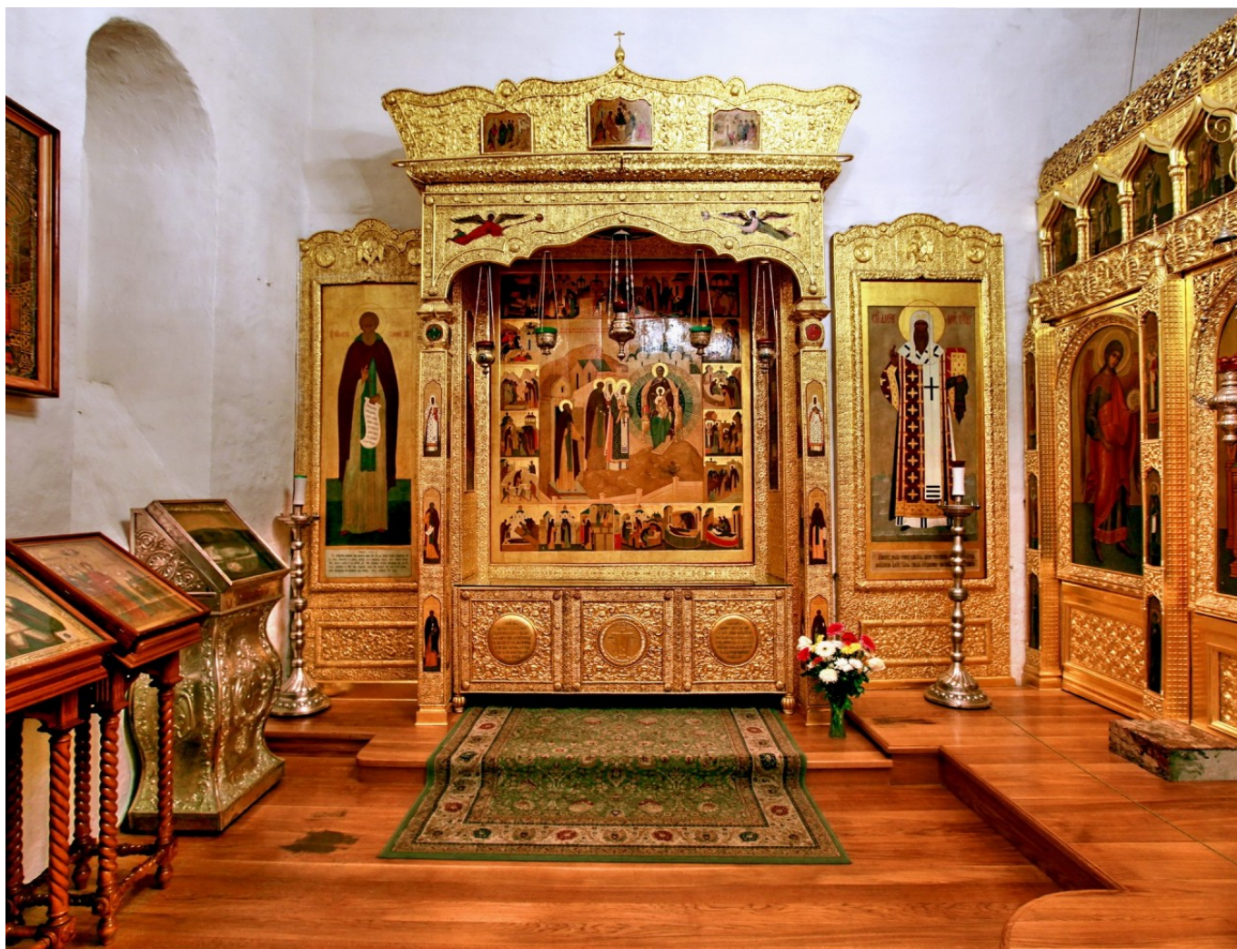
Рака с мощами Никона Радонежского над его могилой в Троице _ Сергиевой лавре

Через 6 лет прп. Савва (память его 3 дек.) по просьбе звенигородского князя Юрия Димитриевича переселился на Сторожевскую гору под Звенигородом для основания там монастыря, и прп. Никон оставил свое уединение и опять принял на себя настоятельство. В 1408 г., во время нашествия хана Едигея, ему явились святители Петр и Алексей с прп. Сергием и сказали, что по воле Божией обитель его будет разорена, но потом еще более процветет. Когда они стали незримы, прп. Никон поспешно вышел из кельи и увидел, что явившиеся идут к церкви. При приближении Едигея он успел с братией вовремя удалиться и спасти книги, священные сосуды и утварь прп. Сергия.